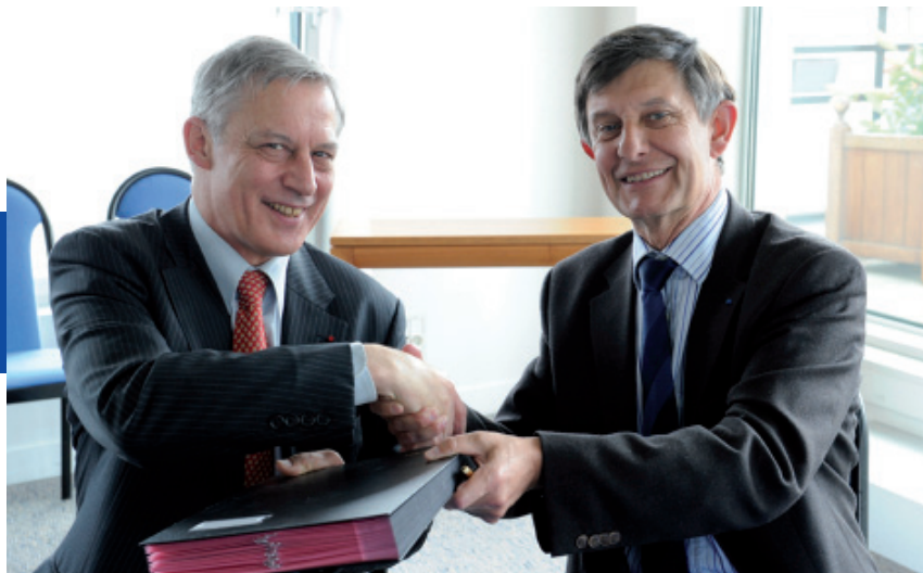
Christian Noyer et Jean-Pierre Jouyet le 30 avril 2010